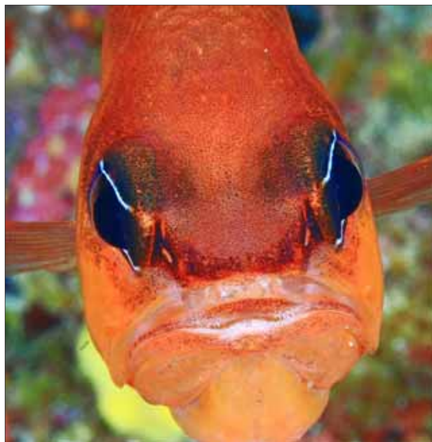
1er premi de primer pla de peix, de Toni Menor (reflex).