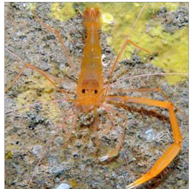
2ºn premi macro selectiu amb compacta, de Toni Cifre.