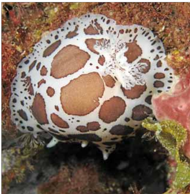
1er premi de macro amb compacta, de M. Àngel Pozo.

És per això que els promotors d'aquest concurs volen aprofitar-lo per cridar una altre vegada l'atenció sobre la necessitat de preservar aquests fons mitjançant la creació d'una reserva marina integral, únic sistema de que es tornin poblar de la biodiversitat que els és característica.